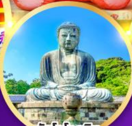
วัดโคโคคุอิน