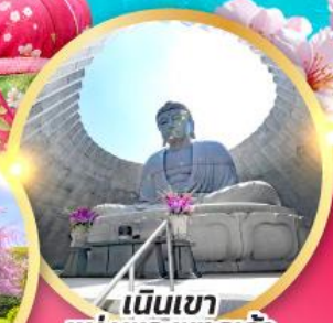
เป็นเขา แห่งพระพุทธรเจ้า