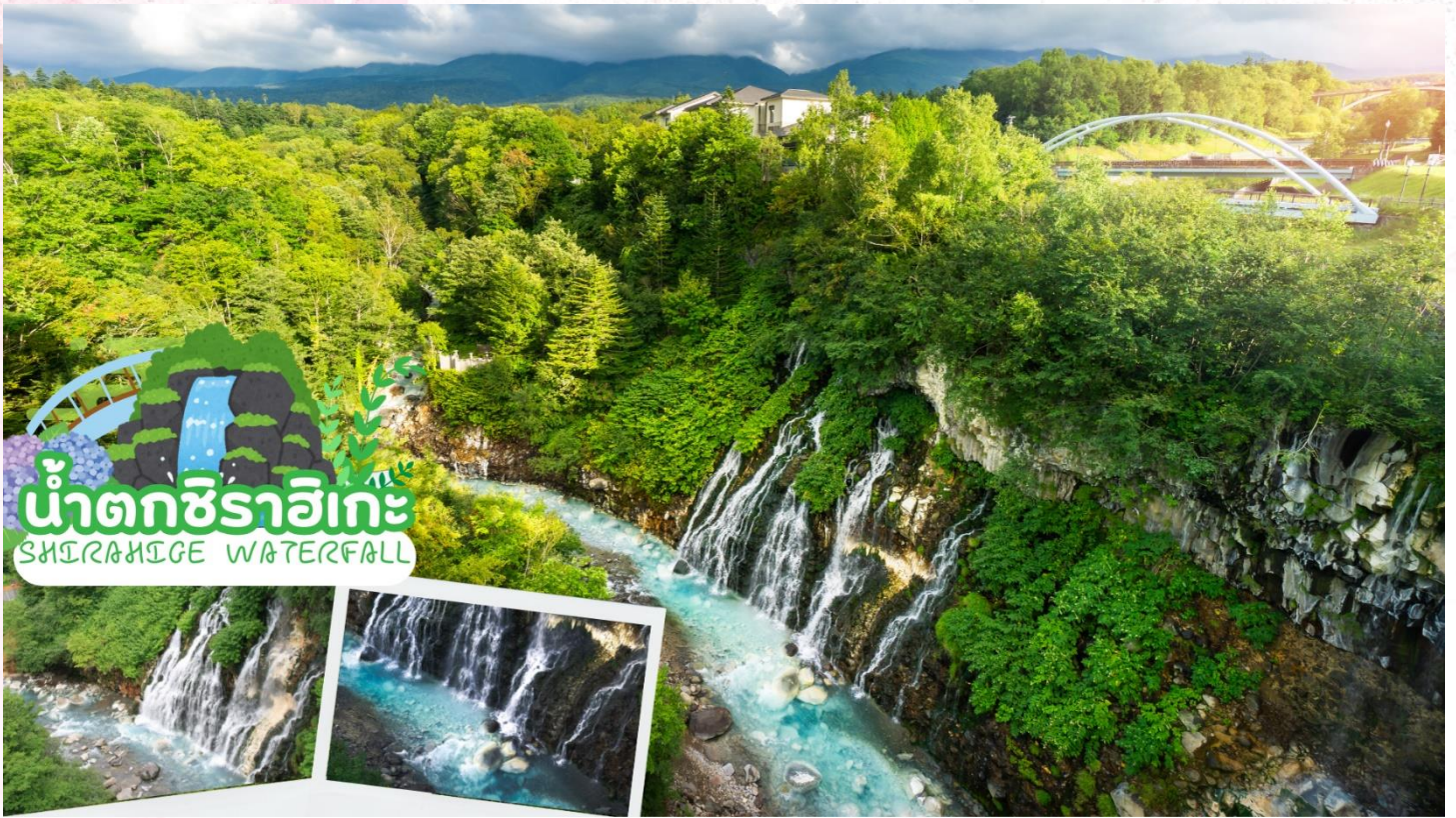
น้ำตกชิราฮิเกะ SHIRAHIGE WATERFALL

เดินทางสู่ เมืองอาฮาชิคาวะ เป็นเมืองที่ใหญ่เป็นอันดับสองของเกาะฮอกไกโด รองจากนครซัปโปโระ มีร้านค้าที่ขายข้าวและผักที่ปลูกได้ในเมือง และยังมีร้านอาหารทะเลตั้งอยู่มากมาย การคมนาคมสมบูรณ์แบบ ทำให้แต่ละปีมีผู้มาท่องเที่ยวกว่า 5 ล้านคนจากทั้งในและต่างประเทศ