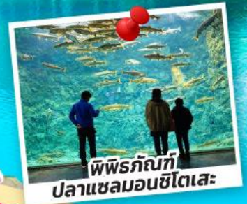
พิพิธภัณฑ์ ปลาแซลมอนชิโตเสะ

ชมซากุระจุใจ ณ สวนอาซาฮิยามะ สวนสาธารณะมารุยามะ