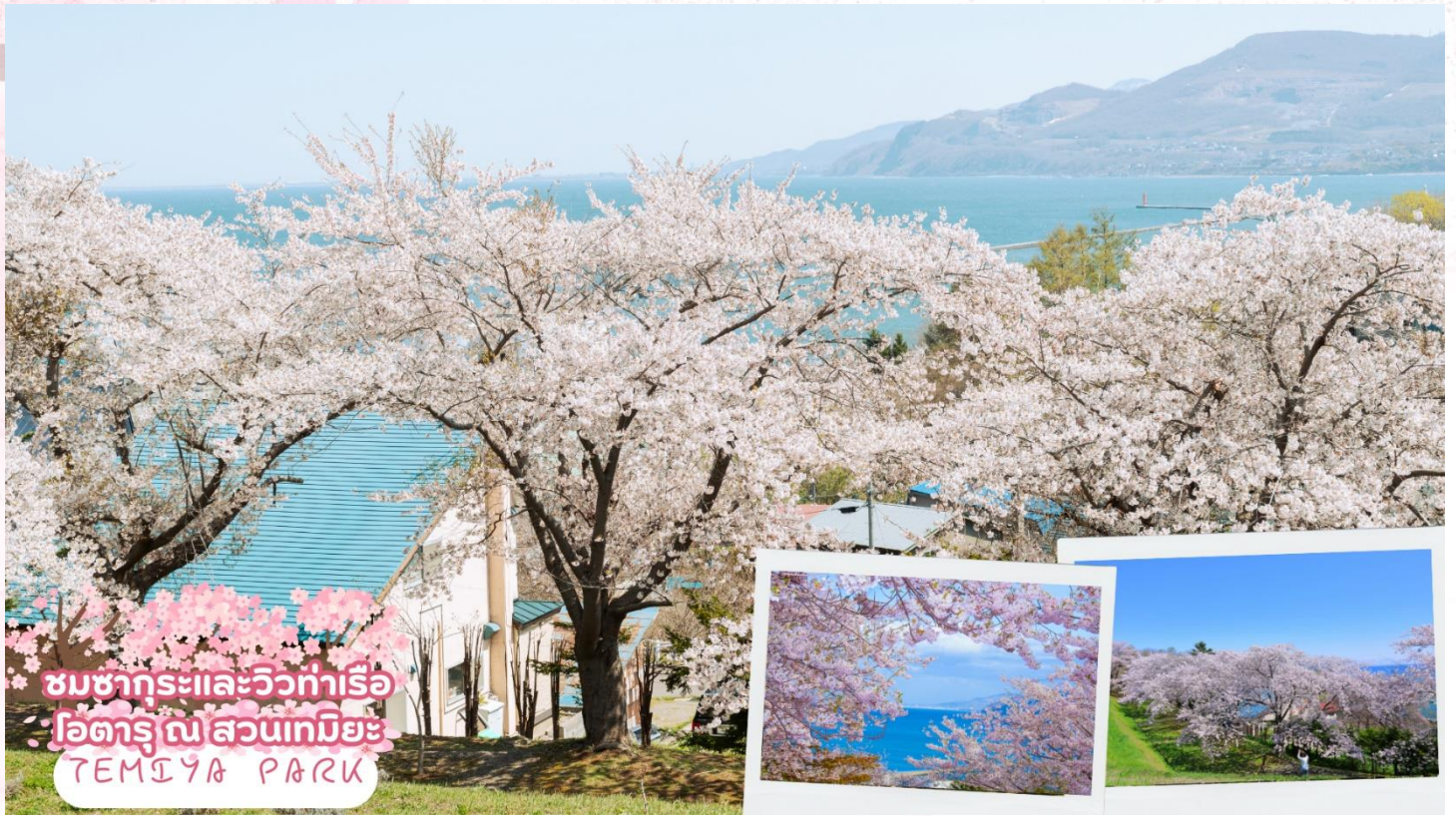
ชมซากุระและวิวท่าเรือ โอดารุ ณ สวนเทมียะ TEMIYA PARK

ชมซากุระและวิวท่าเรือโอดารุ ณ สวนเทมียะ (Temiya Park) เป็นหนึ่งในจุดชมดอกซากุระที่โด่งดังที่สุดในโอดารุในฤดูชมซากุระ อยู่บนภูเขา ช่วงฤดูดอกซากุระผู้คนจะหนาแน่น เนื่องจากที่นี่สามารถชมซากุระพร้อมกับชมทิวทัศน์ท่าเรือโอดารุ เหมาะสำหรับการพักผ่อนหย่อนใจและเพลิดเพลินกับวิวทะเลและดอกซากุระ โดยซากุระจะเริ่มบานในช่วงปลายเดือนเมษายนถึงต้นเดือนพฤษภาคม (ซากุระขึ้นอยู่กับสภาพอากาศของแต่ละปี)