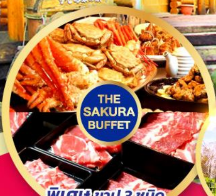
พิเศษ 3 ชนิด (ปูทะเล+ซูโม่+ปูขน)