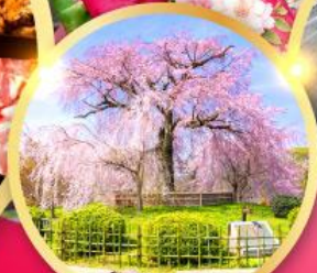
สวนสาธารณะมารุยามะ