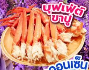
บุฟเฟ่ต์ ขาปู