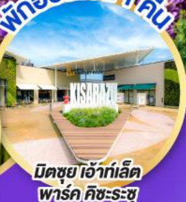
มิตซูย เอ้าท์เล็ต พาร์ค คิชะระชู