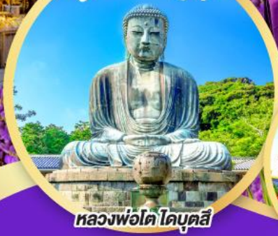
หลวงพ่อโต ไคบุคุสึ