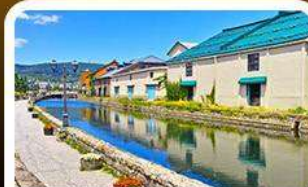
คลองไอตารุ